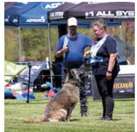
Ruby River's Vincent