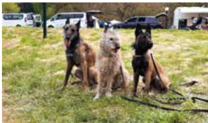
3 Generationen Laekenois: Galdra's mind A Trick of the Tail (mitte) mit ihrem Sohn Galdra's mind Dark Side of the Moon (links) und ihrer Enkelin Ulalumé van de Duvetorre (rechts), Tochter von Floyd)