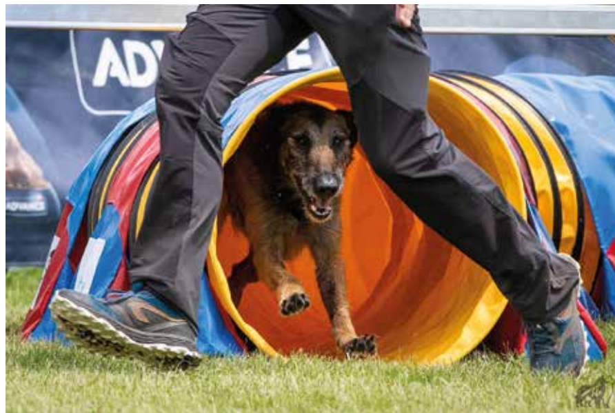
Galdra's mind Dark Side of the Moon