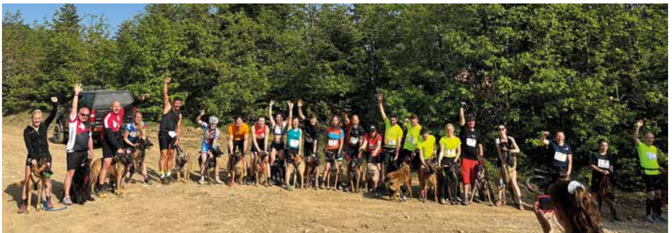
Teilnehmer Canicross und Bikejöring mit Galdra's mind Enjoy the Silence und Modèle Déposé Lollypop

Im nächsten Jahr geht es nach Rumänien. Ich bin sehr gespannt, wie viele Laekenois sich für 2023 qualifizieren können. Wir sind auf jeden Fall dabei!