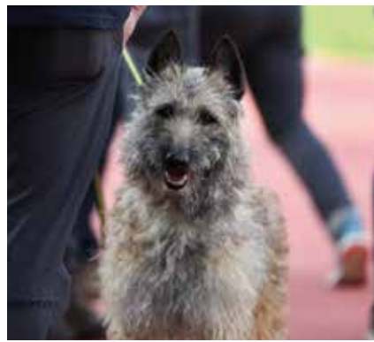
Galdra's mind Enjoy the Silence